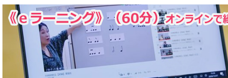
《eラーニング》(60分) オンラインで繰り返し学びます