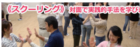
《スクーリング》 対面で実践的手法を学びます

リズム、ティーチング、ピアノ演奏法というカリキュラムの他、子どもたちへの指導風景を見ることも出来ます。